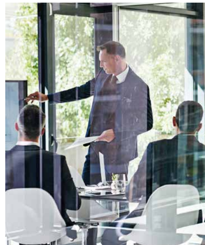
14 Veeam Hybride datamanagement

Your trusted IT partner in a hybrid world.