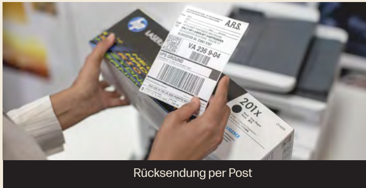
Rücksendung per Post

HP Druckerpatronen und Tonerkartuschen können auf mehreren Wegen zurückgegeben werden: