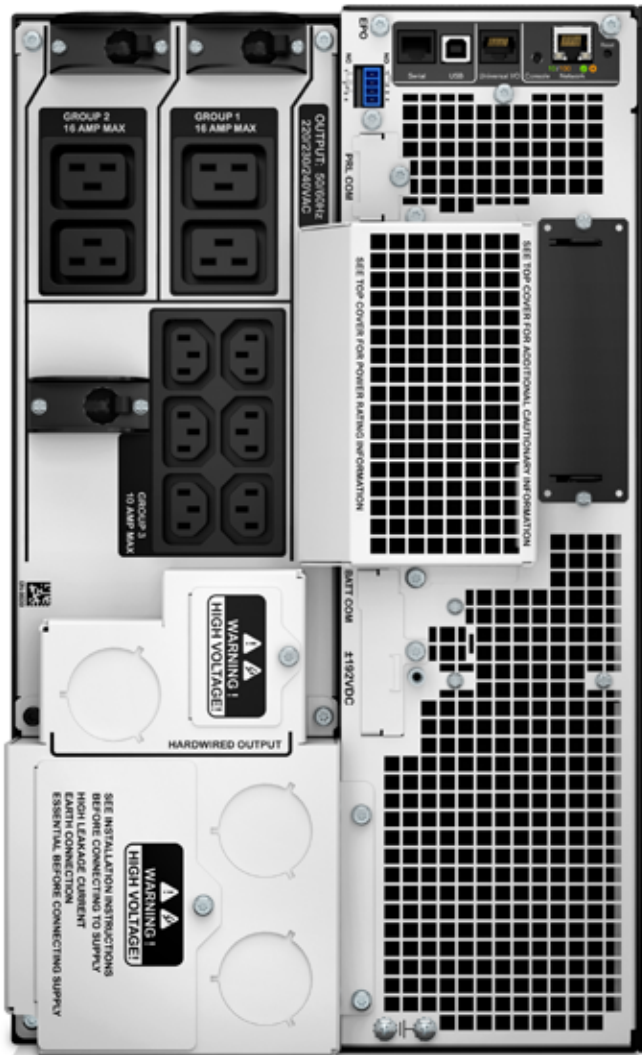
Im Bild: SRT10KXLT

Rackmount- und Towermodell SRT 2,2 kVA – 10 kVA