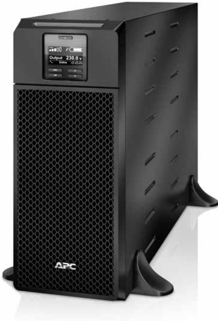
Im Bild: SRT6KXLI

Rackmount- und Towermodell SRT 2,2 kVA – 10 kVA